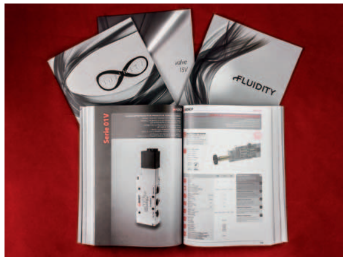
I cataloghi, in sinergia con il web, rendono maggiormente fruibili le informazioni sui prodotti

zione in oltre 90 Paesi nel mondo. Il catalogo si divide in due sezioni: un indice per paragrafo e uno per singolo prodotto in ordine alfanumerico - raccorderia, valvole, attuatori, FRL trattamento aria compressa. A ogni prodotto è dedicata una piccola descrizione sui principali vantaggi e sulle sue applicazioni; una scheda tecnica dove sono riportati i componenti e i materiali che lo costituiscono; una descrizione per l'utilizzo con indicati i valori di pressione e temperatura dei fluidi compatibili, le tipologie di tubi utilizzabili, di filettature disponibili e delle forze di serraggio per la fase di assemblaggio; il disegno tecnico con le dimensioni e i codici relativi alle diverse grandezze disponibili. Il catalogo generale, un volume di 900 pagine in ben sei lingue (italiano, fran-